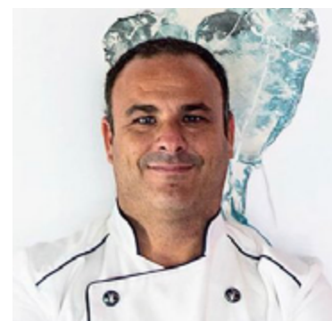
Ángel León APONIENTE 3*** Puerto de Santa María, Cádiz

Se aficionó al mar de pequeño, pescando con su padre, y se acercó a la cocina queriendo aprenderlo todo sobre el mar. Se formó en Francia y, tras su paso por diversos restaurantes en España, regresó a su tierra natal, Cádiz, para poner en marcha su propio restaurante. En la actualidad, Aponiente está enclavado en un espacio tan singular como un antiguo molino de mareas. El “chef del mar” es conocido en el panorama gastronómico gracias a un estilo centrado en productos marinos. Es el primer cocinero del mundo que ha desarrollado el plancton marino como ingrediente nutritivo para el consumo. La cocina marina de Ángel León se puede degustar en Aponiente, en el Puerto de Santa María, que cuenta con tres estrellas Michelin y también ha sido distinguido con la Estrella Verde de Michelin a la sostenibilidad. Alevante, situado en el complejo hotelero Meliá Sancti Petri en Chiclana, en el que también ha obtenido una estrella.