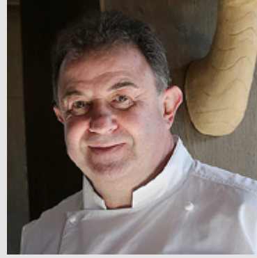
Martín Berasategui MARTÍN BERASATEGUI 3*** Lasarte-Oria. Guipúzcoa

Es el chef con más estrellas Michelin, 12 en total, del panorama gastronómico español: tres en el restaurante Martín Berasategui, en Lasarte, Guipúzcoa; otras tres en el restaurante Lasarte de Barcelona, dos en el MB de Tenerife, otra estrella en Oria, también en Barcelona, una en eMeBe Garrote en San Sebastián, otra en el restaurante Ola de Bilbao y una más en Fifty Seconds en Lisboa. Con más de 40 años de profesión, Martín Berasategui es uno de los cocineros más laureados, maestro de algunos de los grandes chefs de la actual cocina española y también asesor de más de una docena de establecimientos en todo el mundo.