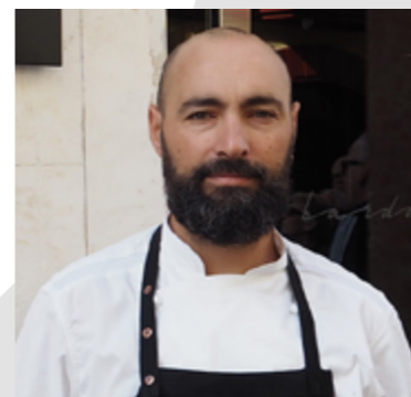
Benito Gómez BARDAL 2** Ronda. Málaga

Quique Dacosta es de origen extremeño y valenciano de adopción. Este chef empezó su incursión en la cocina muy joven y ya le gustaba indagar en los libros de los cocineros franceses que trabajaban en líneas culinarias diferentes a las que él conocía hasta ese momento. Así comienza también su afición a visitar los mejores restaurantes gastronómicos en España. En 1988 entra a trabajar en el que hoy es su restaurante, antes llamado El Poblet, que en sus inicios ofrecía una cocina castellana y que después dio un giro hacia una gastronomía basada en productos del mar y de proximidad. Ya bajo la dirección de Quique Dacosta se crea una cocina actualizada con nuevas técnicas, parte de los productos locales, como leitmotiv de su obra, pero siempre con una ventana abierta al mundo y a las culturas de otros países para enriquecer su propia cocina. Hoy Quique Dacosta tiene tres estrellas Michelin en el restaurante que lleva su nombre, su buque insignia situado en Denia, dos estrellas en su propuesta valenciana en El Poblet y una estrella en el recién inaugurado Deessa, en el hotel Mandarin Oriental Ritz.