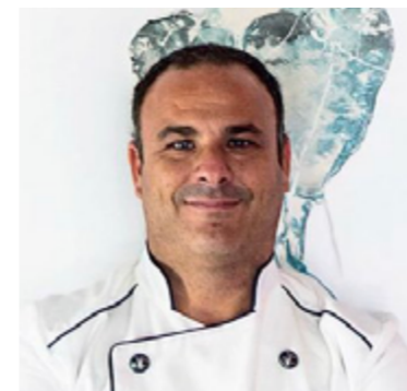
Ángel León APONIENTE 3*** Puerto de Santa María, Cádiz

Se aficionó al mar de pequeño, pescando con su padre, y se acercó a la cocina queriendo aprenderlo todo sobre el mar. Se formó en Francia y, tras su paso por diversos restaurantes en España, regresó a su tierra natal, Cádiz, para poner en marcha su propio restaurante. En la actualidad, Aponiente está enclavado en un espacio tan singular como un antiguo molino de mareas. El “chef del mar” es conocido en el panorama gastronómico gracias a un estilo centrado en productos marinos. Es el primer cocinero del mundo que ha desarrollado el plancton marino como ingrediente nutritivo para el consumo. La cocina marina de Ángel León se puede degustar en Aponiente, en el Puerto de Santa María, que cuenta con tres estrellas Michelin y también ha sido distinguido con la Estrella Verde de Michelin a la sostenibilidad. Alevante, situado en el complejo hotelero Meliá Sancti Petri en Chiclana, en el que también ha obtenido una estrella.