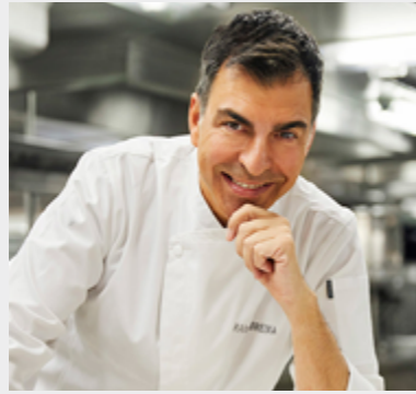
Ramón Freixa RAMÓN FREIXA 2** Madrid

El chef procede de una familia de restauradores catalanes y dirige el restaurante Ramón Freixa en Madrid, galardonado con dos estrellas Michelin. Ubicado en el Hotel Único, este proyecto gastronómico acaba de cumplir su décimo aniversario en la capital. En la cocina de Ramón Freixa hay atrevimiento, innovación y sensatez, una técnica impecable y numerosos juegos visuales y gustativos. En su apuesta culinaria conviven la tradición y la vanguardia, un punto de locura en contraste con una buena dosis de sentido común, y todos estos ingredientes unidos en perfecta armonía. Cada plato esconde una historia contada en secuencias, presentadas en composiciones de gran belleza estética, donde el protagonista siempre es el sabor.